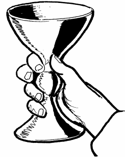
3. PAGSISIMBA AT PAGTANGGAP NG MGA SAKRAMENTO