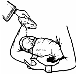
2. PAGPAPA- BAUTISMO