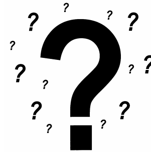
9. MAYROON PA BANG IBA?