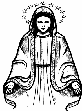
7. PAGDARASAL AT PAGIGING TAPAT KAY MARIA