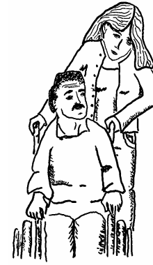
4. PAGIBIG SA IYONG KAPUWA