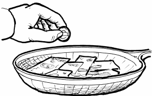
6. PAGAWA NG MGA MABUTI