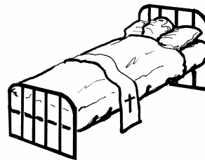
8. PAGKUKUMPISAL NG LAHAT NG KASALANANG MORTAL BAGO MAMATAY