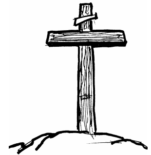
10. PAGTITIWALA KAY JESUS BILANG TAGAPAGLIGTAS